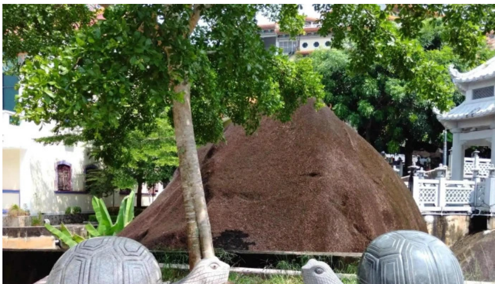
Kuil kek lok si ayer itam