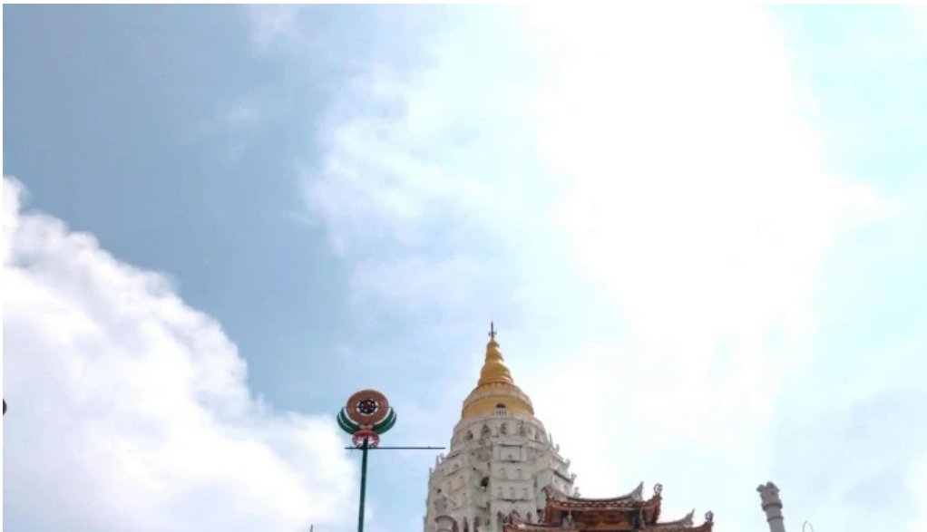
Kuil kek lok si laman web