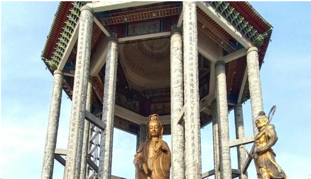
Kuil kek lok si ulasan