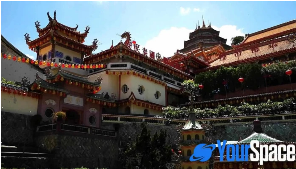
Kuil kek lok si video