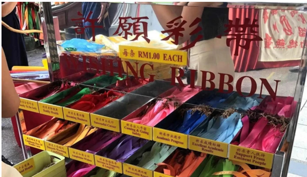
Kuil kek lok si nombor