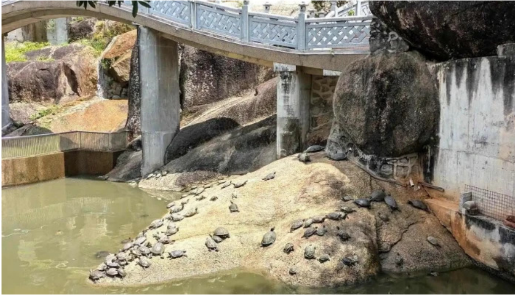
Kuil kek lok si terkini