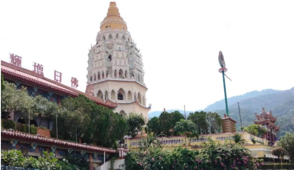
Kuil kek lok si buka sekarang