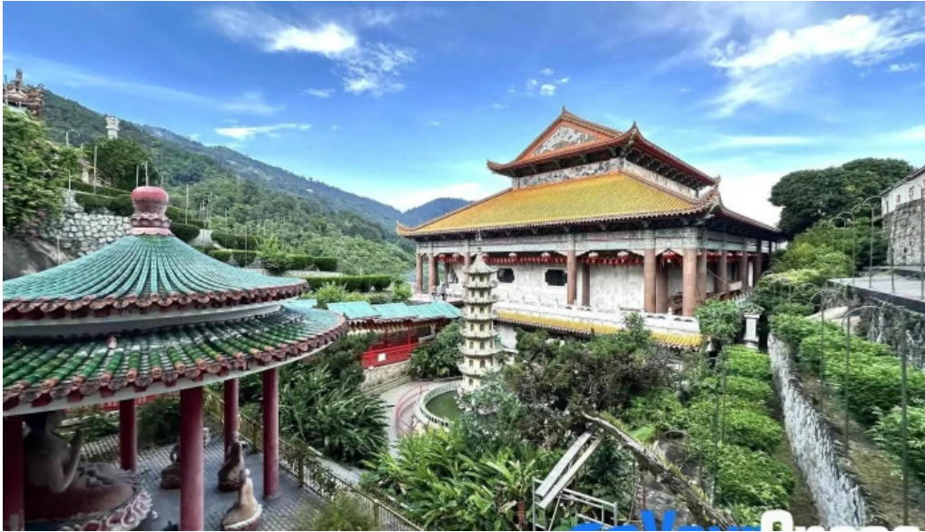
Kuil kek lok si kuil buddha