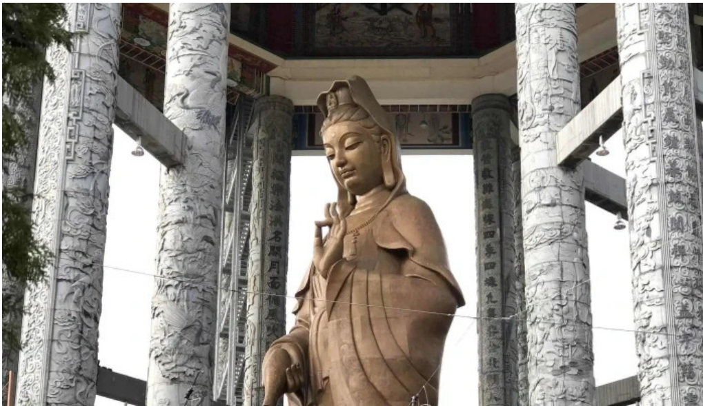
Kuil kek lok si katalog