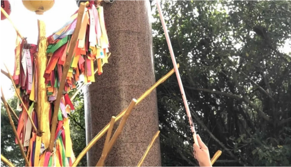
Kuil kek lok si lokasi