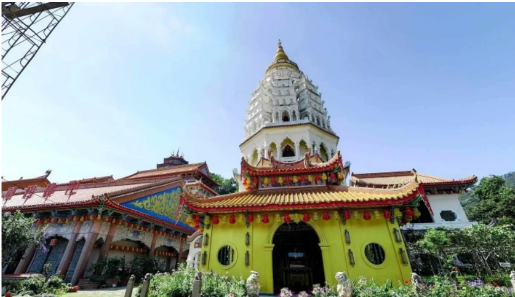
Kuil kek lok si street view 360deg