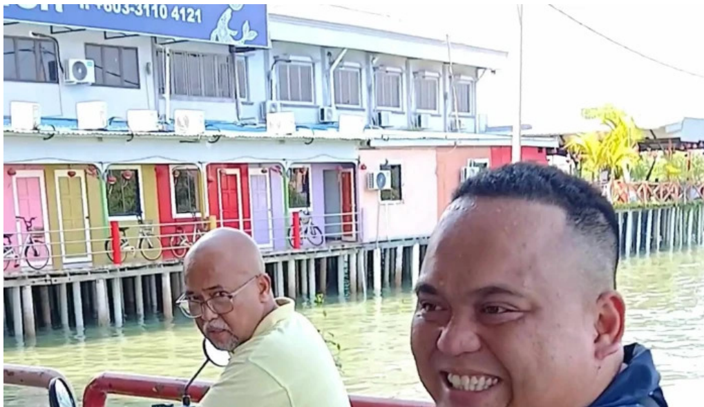
Jetty pulau ketam laman web