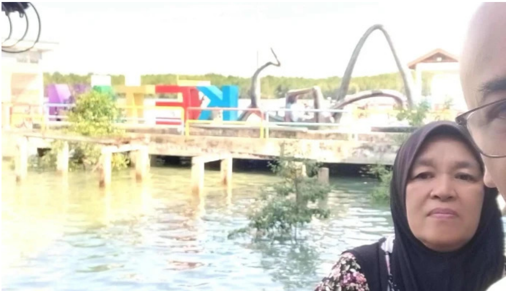
Jetty pulau ketam promosi