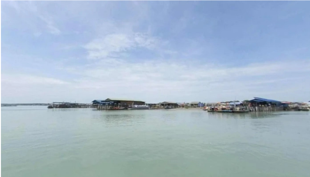
Jetty pulau ketam street view 360deg