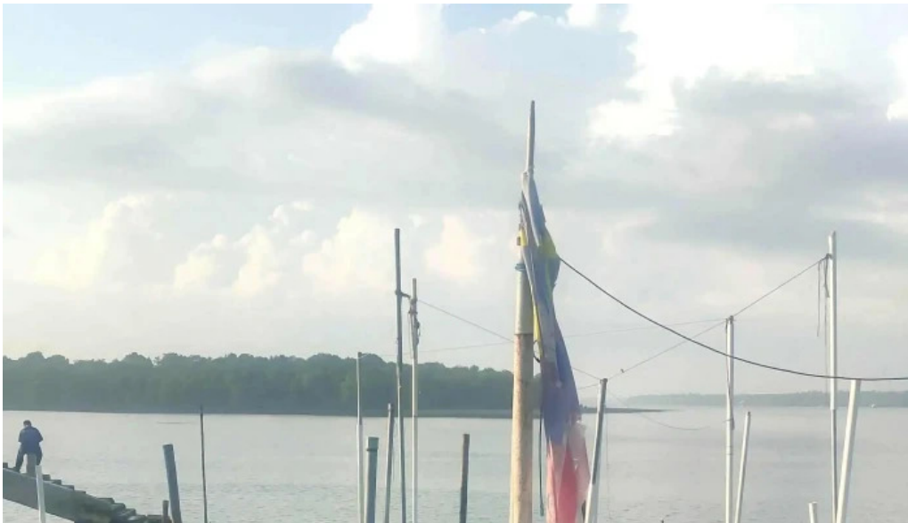
Jetty pulau ketam instagram