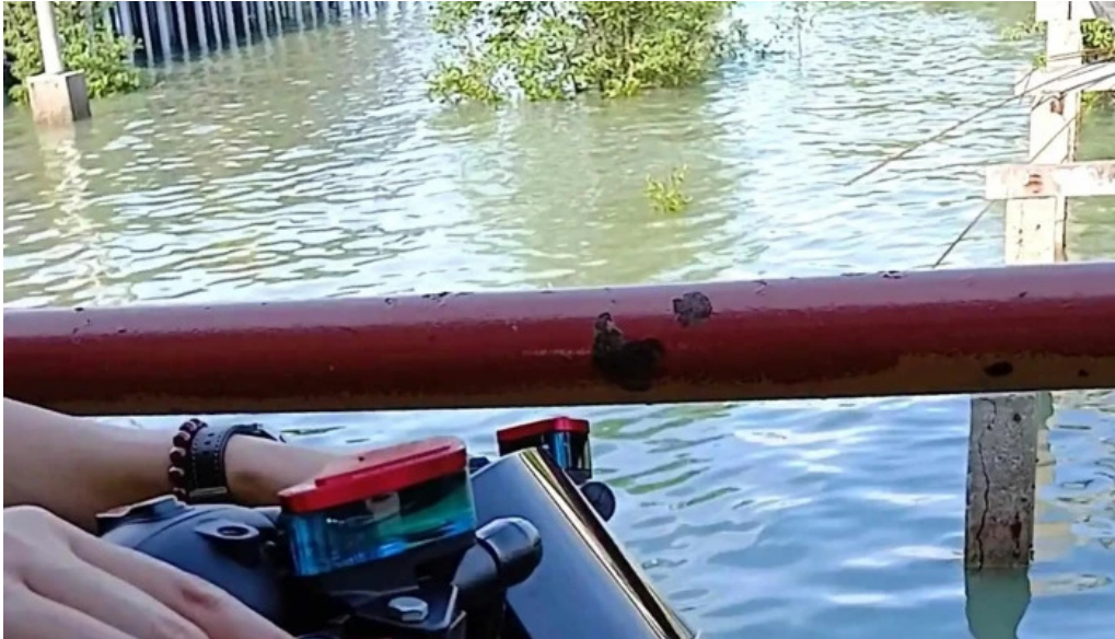
Jetty pulau ketam buka sekarang