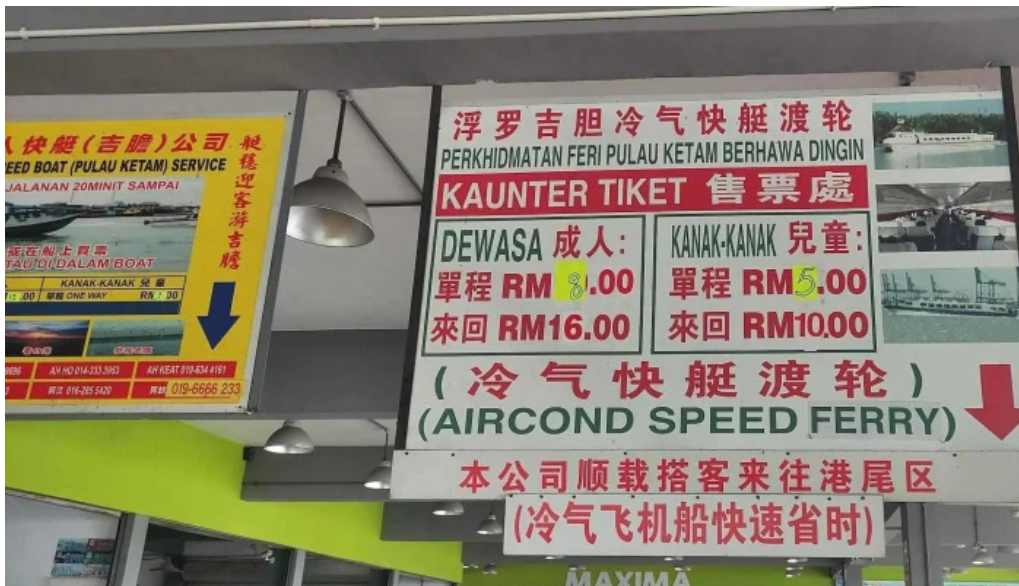
Jetty pulau ketam diskaun