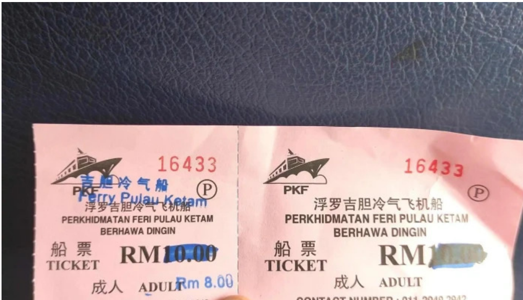
Jetty pulau ketam pulau ketam