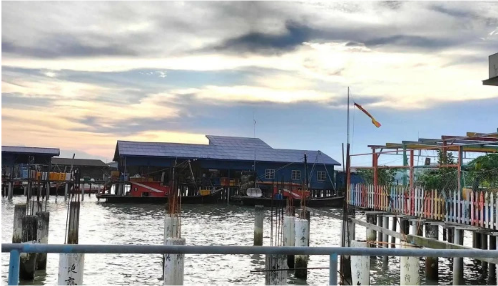
Jetty pulau ketam perkhidmatan feri