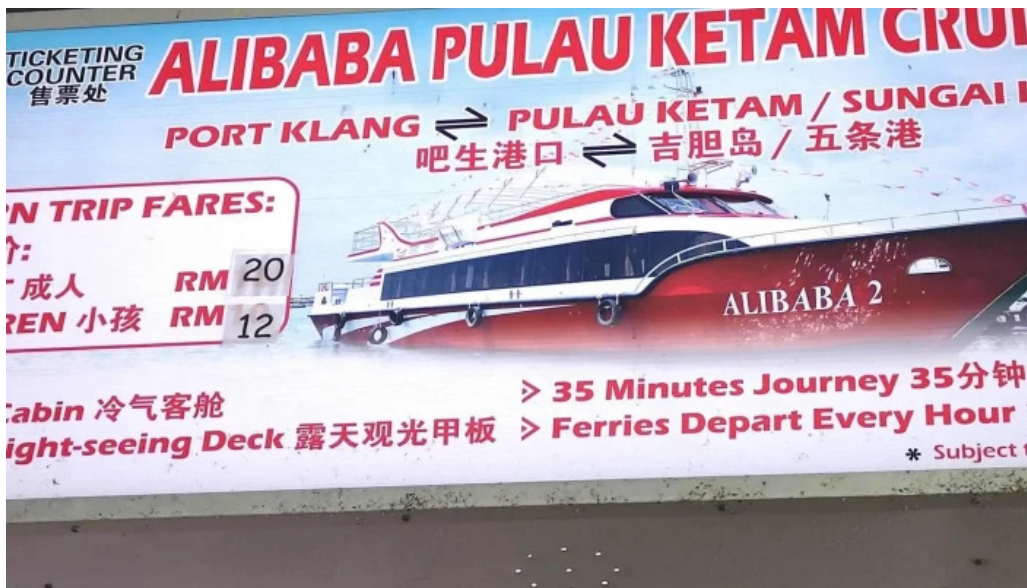
Jetty pulau ketam alamat