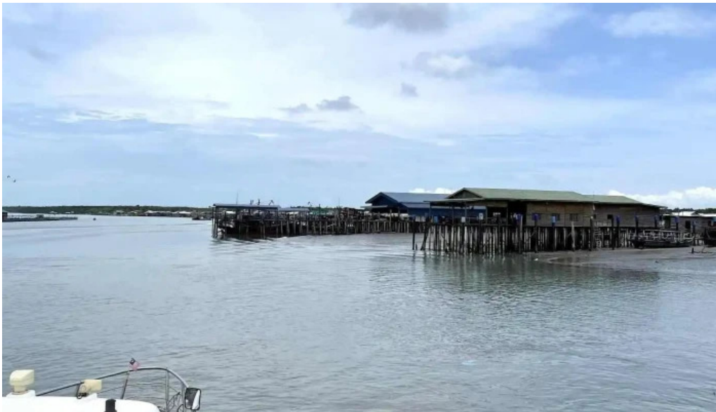
Jetty pulau ketam perahu