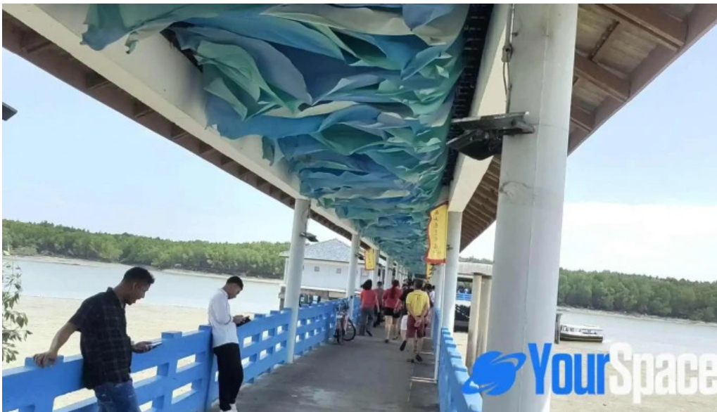
Jetty pulau ketam terkini