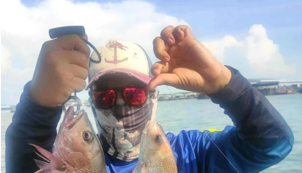
Jetty pulau ketam video