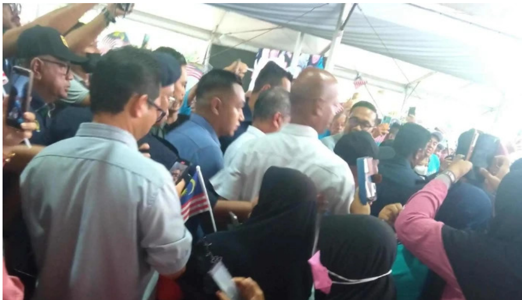
Dataran kerian permai cara ke sana