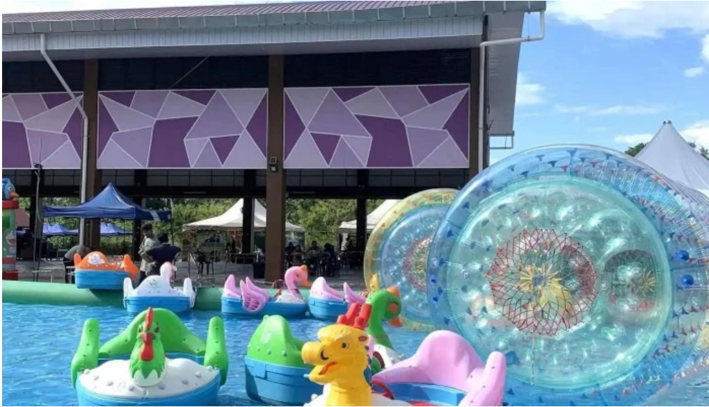
Dataran kerian permai tanda tempat bersejarah