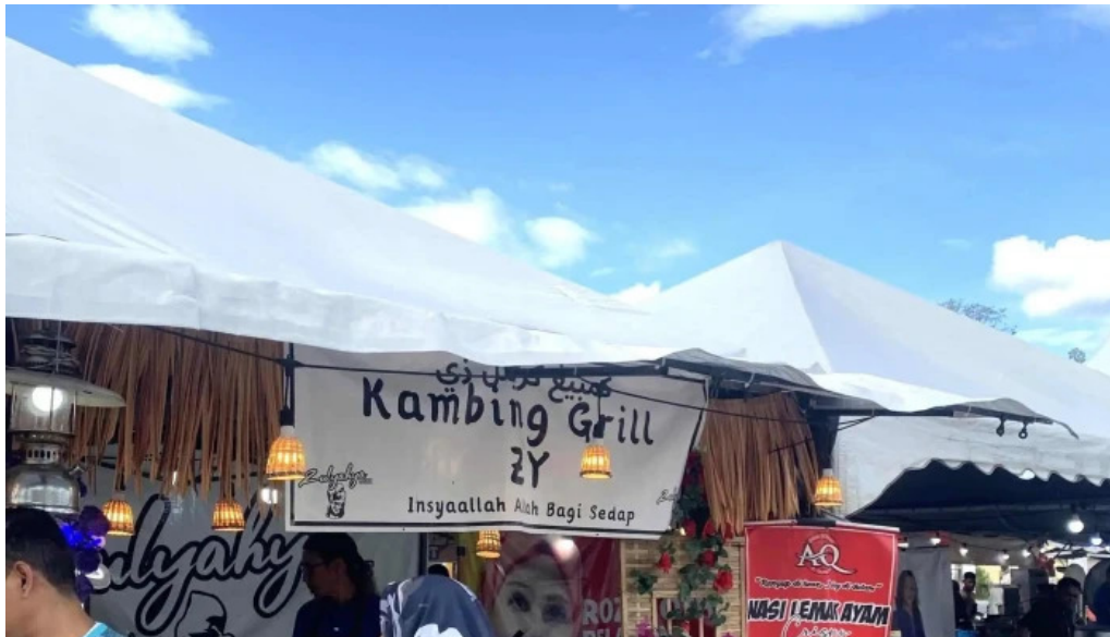
Dataran kerian permai foto