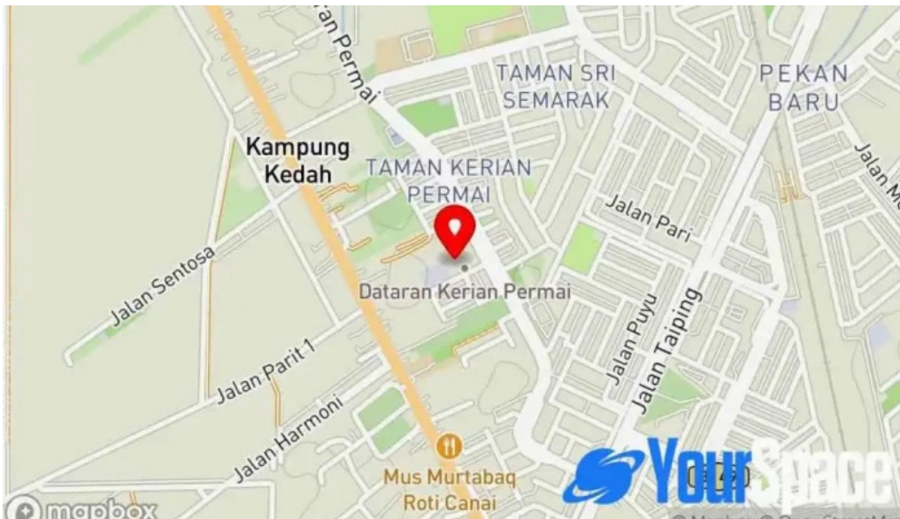
Dataran kerian permai peta