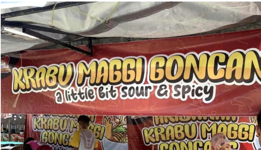
Dataran kerian permai parit buntar