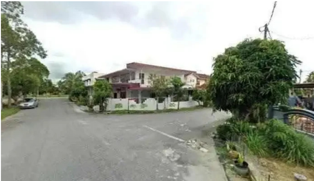
Dataran kerian permai street view 360deg