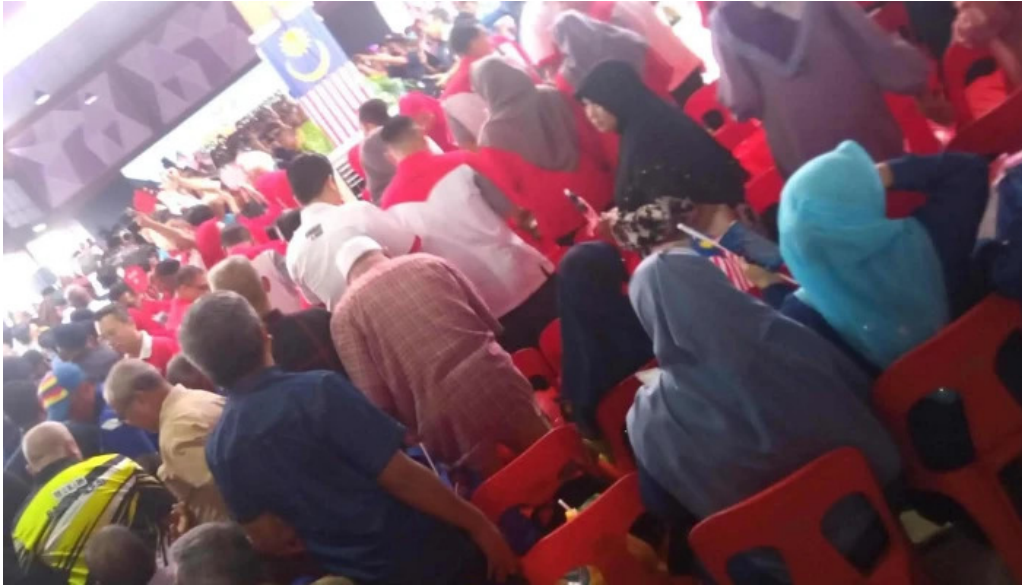
Dataran kerian permai ulasan