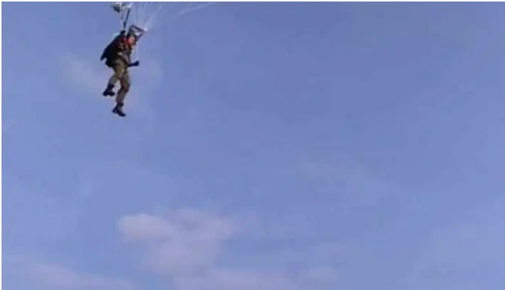
Dataran kerian permai video