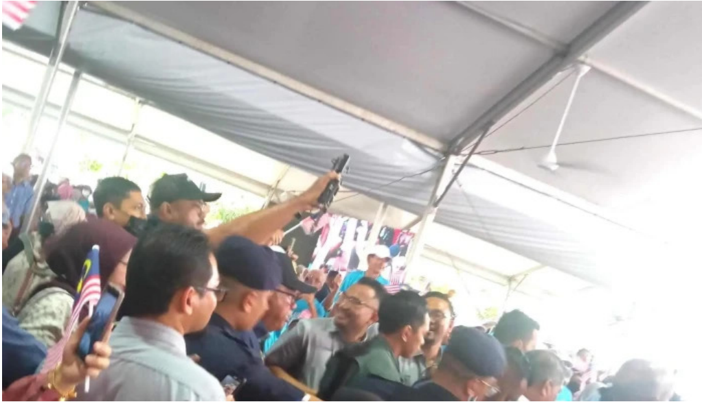
Dataran kerian permai lokasi