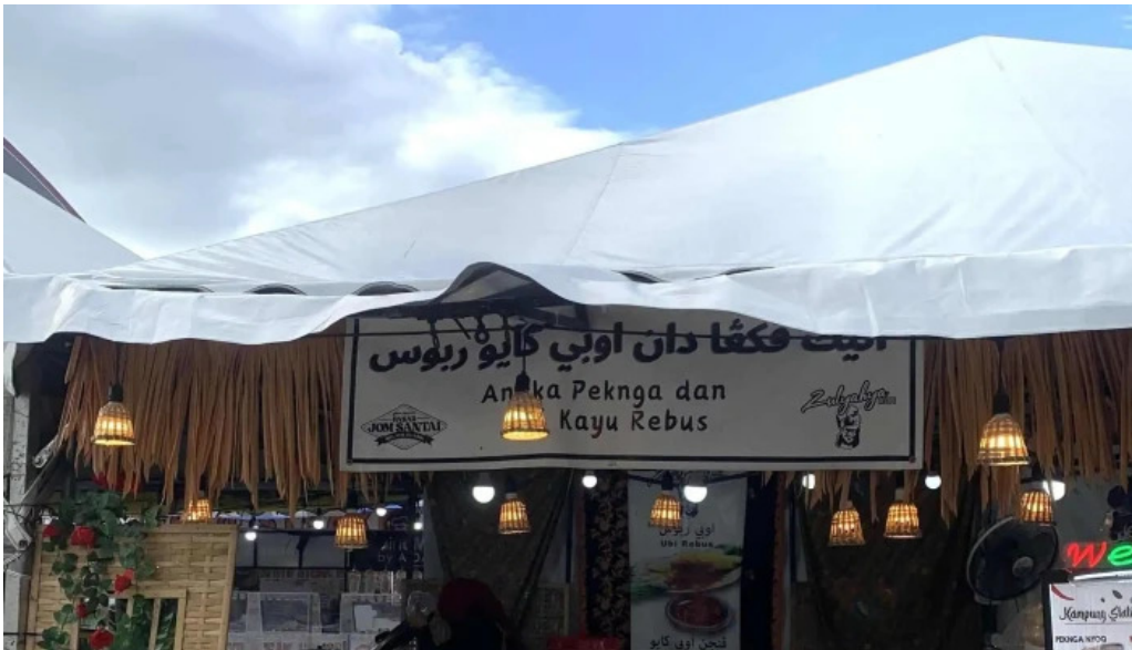
Dataran kerian permai telefon