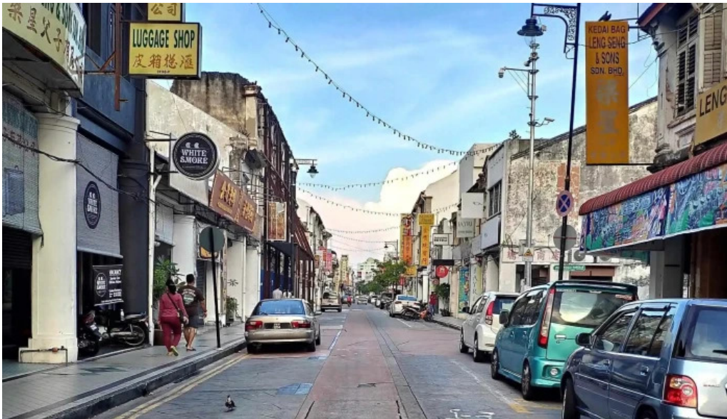
Georgetown unesco historic site cara ke sana