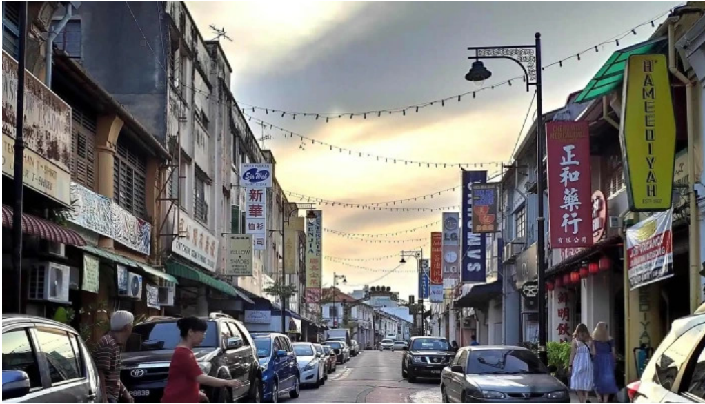
Georgetown unesco historic site george town