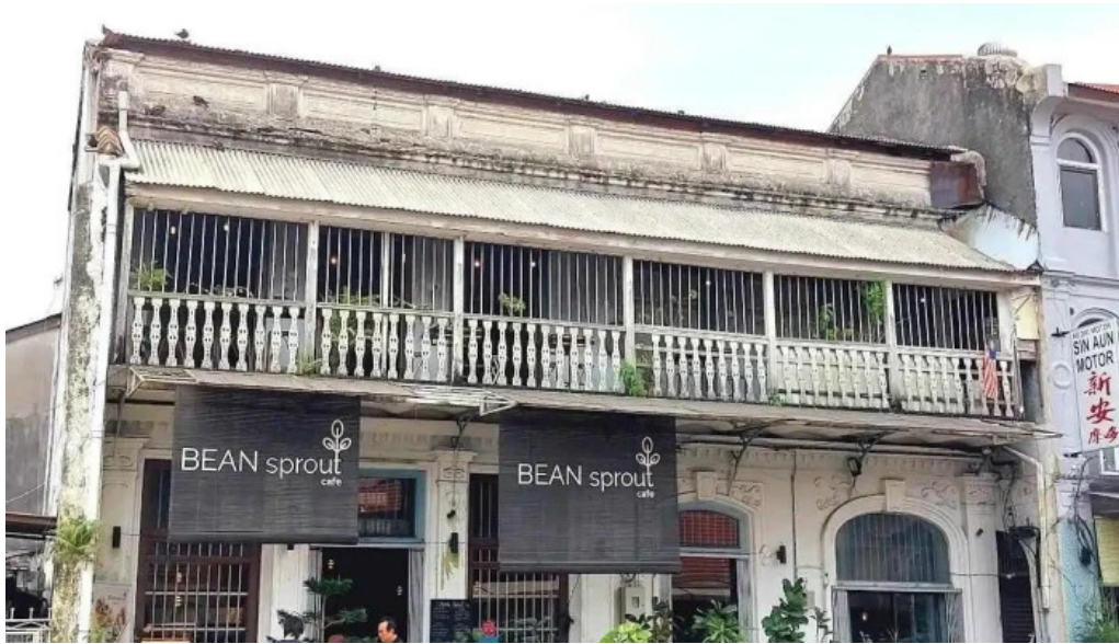
Georgetown unesco historic site terkini