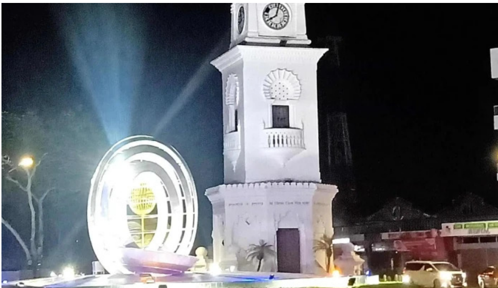
Georgetown unesco historic site buka sekarang