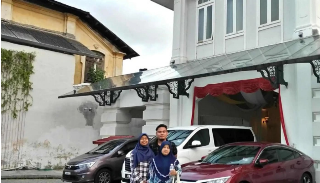
Georgetown unesco historic site lokasi