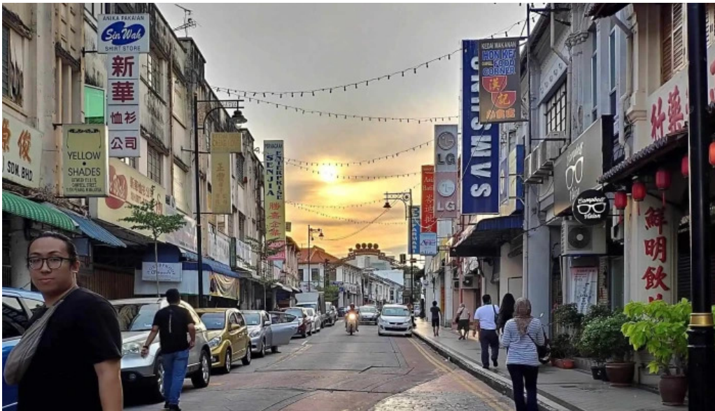
Georgetown unesco historic site foto