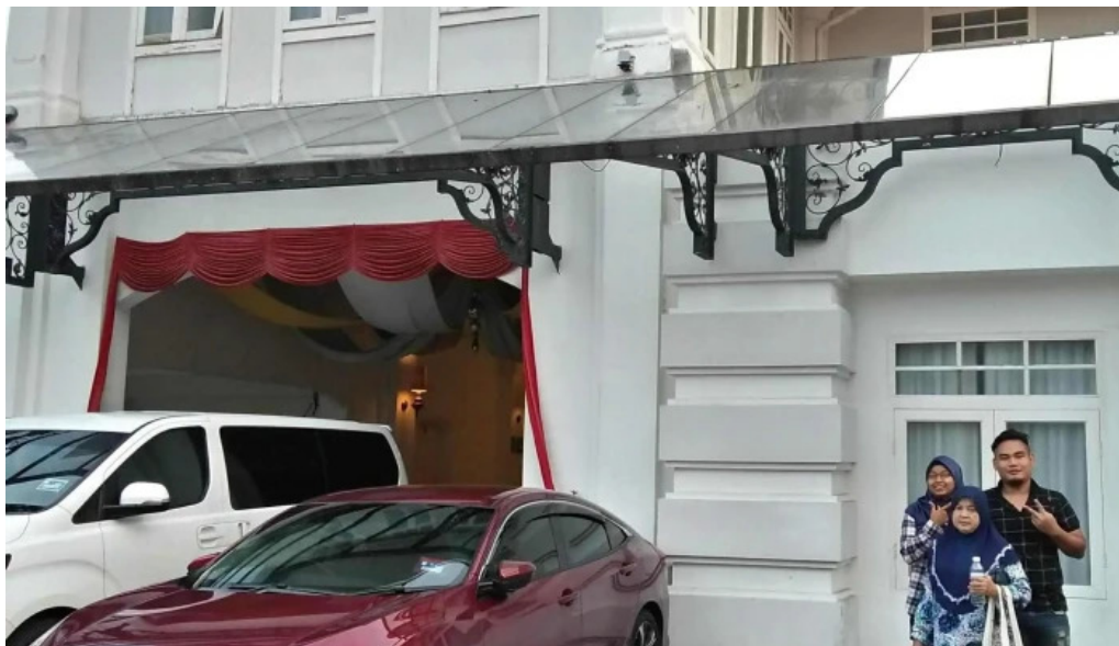
Georgetown unesco historic site nombor