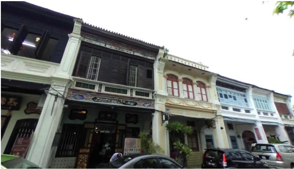
Georgetown unesco historic site street view 360deg