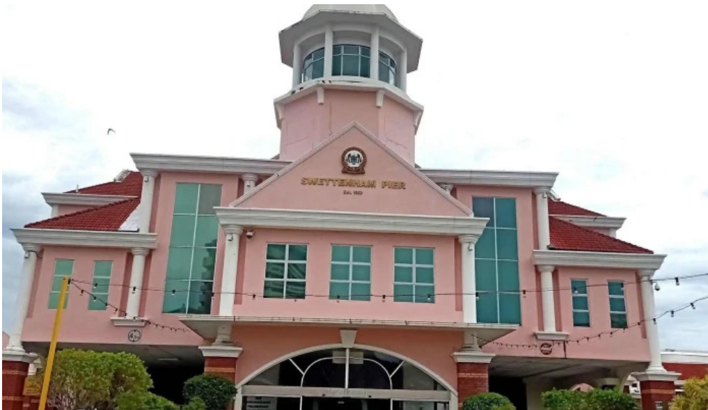
Georgetown unesco historic site berdekatan saya