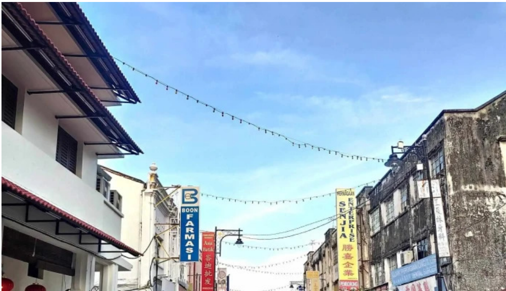
Georgetown unesco historic site harga