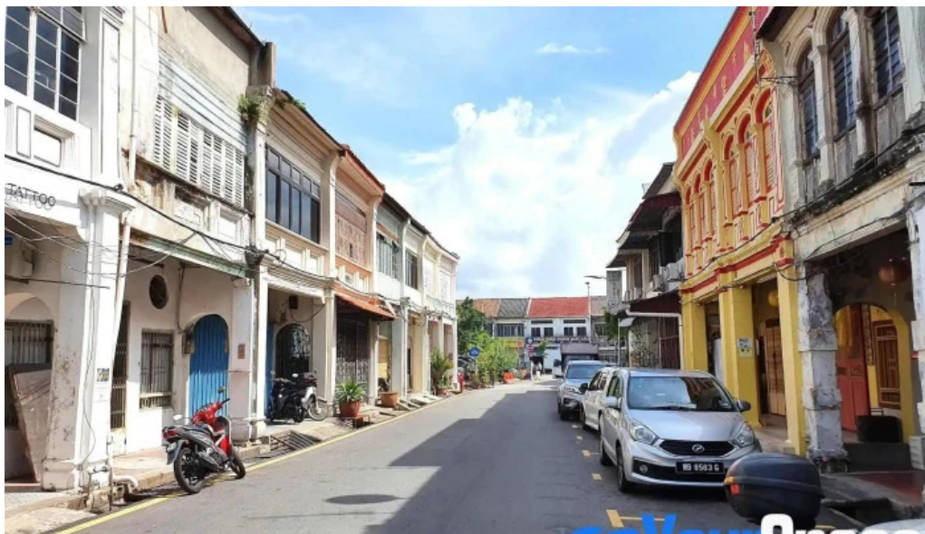
Georgetown unesco historic site tempat tarikan pelancong