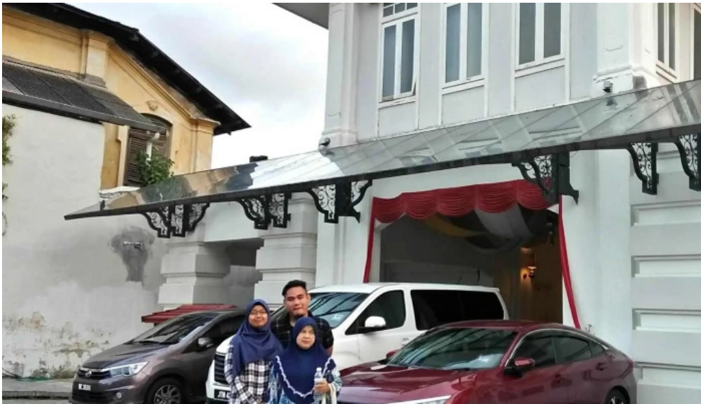
Georgetown unesco historic site skor