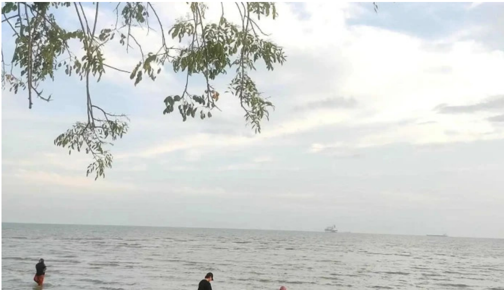
Pantai kgtengah kuala sungai baru tempat tarikan pelancong