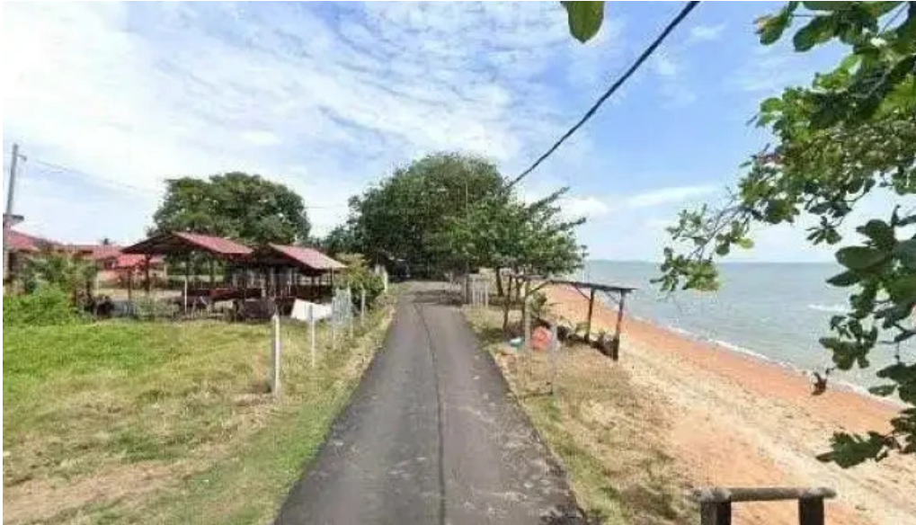
Pantai kgtengah kuala sungai baru street view 360deg