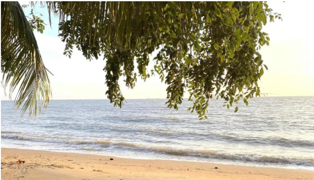
Pantai kgtengah kuala sungai baru berdekatan saya