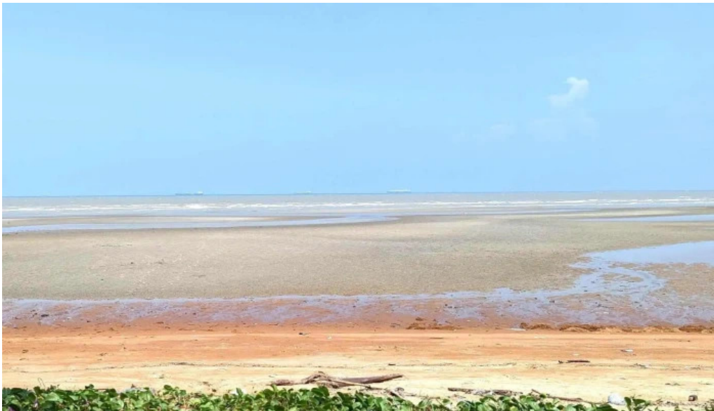
Pantai kgtengah kuala sungai baru promosi