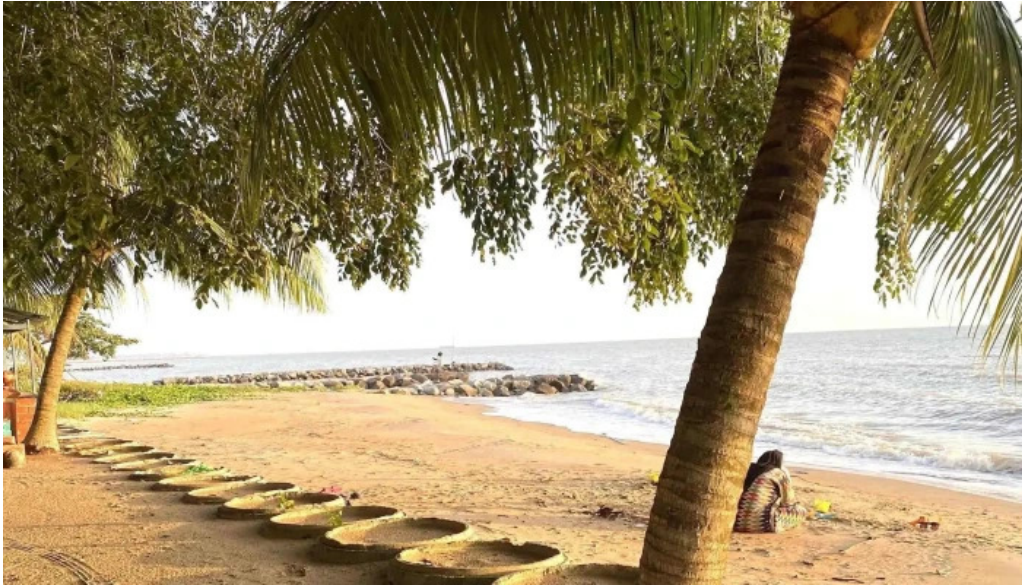
Pantai kgtengah kuala sungai baru di mana