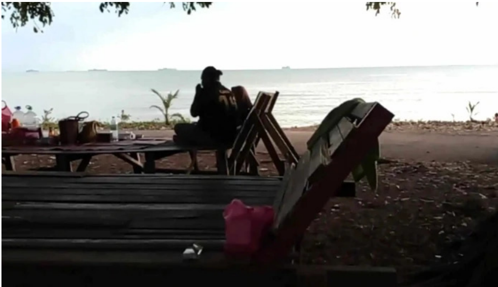
Pantai kgtengah kuala sungai baru ulasan