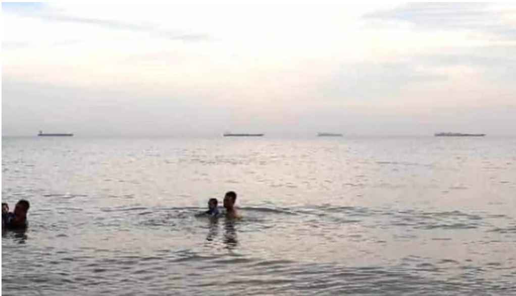
Pantai kgtengah kuala sungai baru jadual