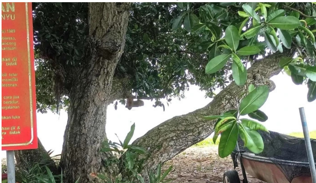
Pantai kgtengah kualasungai baru video