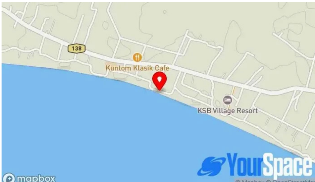
Pantai kgtengah kuala sungai baru peta