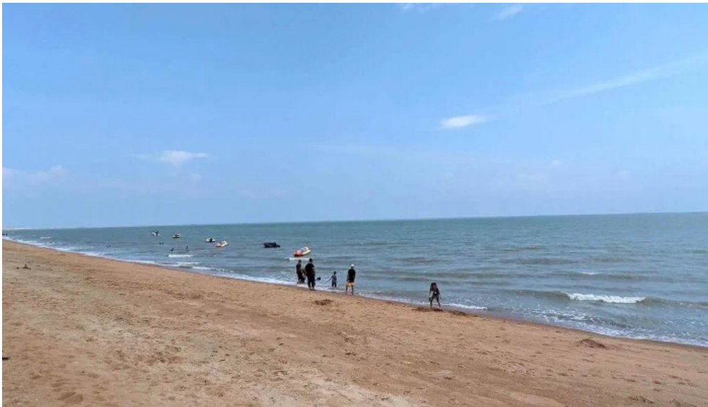
Pantai kgtengah kuala sungai baru nombor