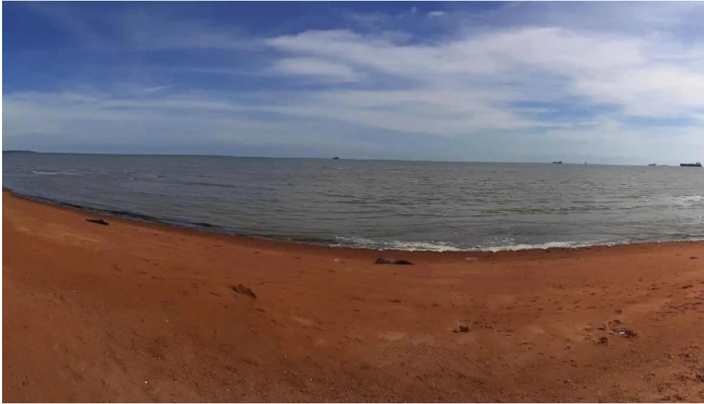
Pantai kgtengah kuala sungai baru kuala sungai baru