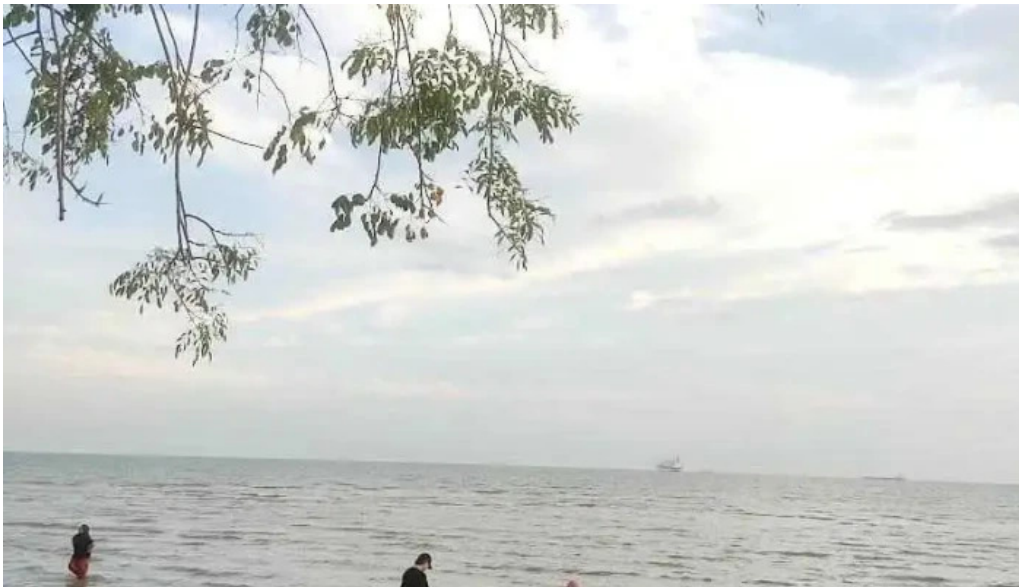
Pantai kg tengah kuala sungai baru kuala sungai baru